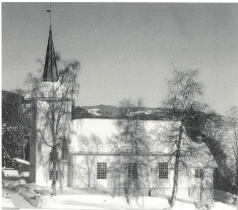
Sørum kirke i Bjønøra se artikkel s. 52