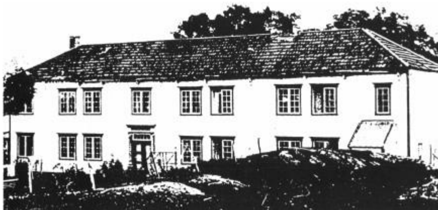
Hovedbygningen stod ferdig i 1823. (kopi fra Steigen Bygdebok Bd. 1)

De tenkte nok på grunnarbeidet til den store hovedbygningen som stod ferdig i 1823. Den var 44 alen lang, 10 \frac{1}{2} alen bred og 8 \frac{3}{4} alen høy til åsene og bestod av to etasjer. Ellers fantes det følgende bygninger på handelsstedet: Borgstue : en bygning som bestod av bakerhus, kammers, ildhus og sjå, videre snekkerstue, stabbur og en 3-etasjes brygge 281/2 alen lang, 161/2 alen bred og 8 alen høy. Alle disse bygningene var verdsatt til 2387 spd, hvorav hovedbygningen hele 1500 spd. Det er tydelig at oppgangen hadde startet allerede i 1820-årene for Brateng.